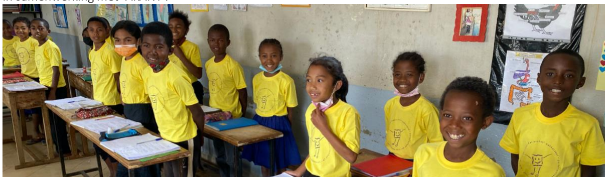
Leerlingen van de kleuterschool

Een rommelmarkt kan ook dit jaar niet ontbreken! Deze gaat door op vrijdag 3 mei. De opbrengst gaat, net als de opbrengst van de sobere maaltijd, naar het scholengemeenschapoverkoepelend project in Madagaskar. Dit in samenwerking met 'AKANY'.